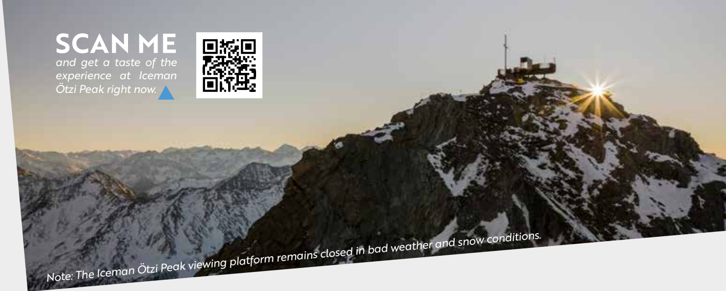
Note: The Iceman Ötzi Peak viewing platform remains closed in bad weather and snow conditions.